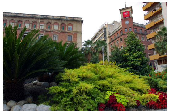
Jardines de la plaza de la Constitución.

Paseo abajo está el Museo de Jaén , que acoge en su sección de arqueología la mayor colección de escultura íbera de España, formada por los conjuntos de Cerrillo Blanco de Porcuna y de El Pajarillo de Huelma , dos de los grandes estandartes de la iniciativa turística Viaje al Tiempo de los Íberos. Estas colecciones son el germen del futuro Museo Internacional de Arte Íbero que se construirá en el solar de la vieja cárcel de Jaén. El Museo de Jaén es un edificio neoclásico de planta cuadrada y torreones en las esquinas construido en 1920 por el arquitecto Antonio Flórez Urdapilleta. En su fachada principal fue instalada la portada del antiguo Pó-