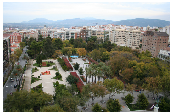
Vista aérea del parque Municipal de Jaén.