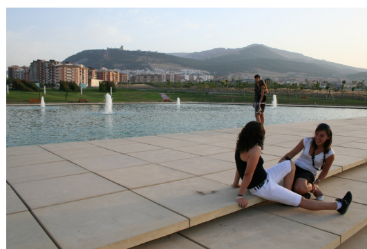
Jóvenes en el parque de Andrés de Vandelvira.