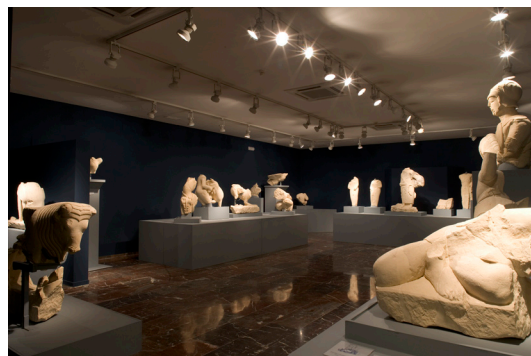
Una de las salas del Museo de Jaén.

El antiguo edificio del Banco de España , obra del arquitecto Rafael Moneo, se encuentra frente a la plaza Jaén por la Paz , otro cruce de caminos del Jaén más reciente. El barrio de Expansión Norte nos lleva a las grandes avenidas del Paseo de España , del Bulevar y a los parques del mismo nombre y Andrés de Vandelvira.